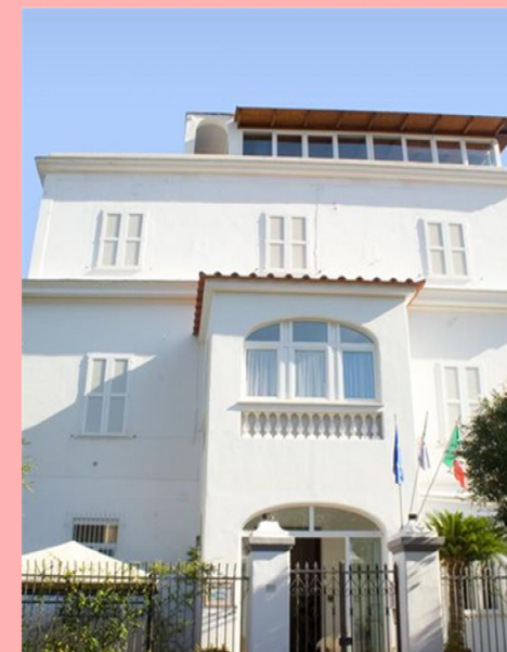
NUESTRA RESIDENCIA EN CORSO LUIGI MANZI 12 (80074 CASAMICCIOLA TERME, ISCHIA)